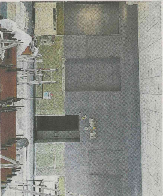
Il salone della scuola Primaria durante i lavori

L'altra novità riguarda invece i ragazzini delle medie che, dall'11 settembre, avranno aule "all'americana": non sarà più il docente a doverli spostare nelle varie classi, ma, al contrario, saranno i ragazzi a raggiungere i prof nell'aula di Matematica, nell'aula di Mondo (Storia, Geografia, Religione), in quella di Italiano, nei laboratori di Lingue o in quella di Creatività (Educazione Tecnica e Arte). "Anche in questo caso, non si tratta di una scelta campata in aria, ma è frutto di una teoria neuroscientifica che sostiene che ai ragazzi faccia bene spostarsi di aula a ogni cambio di materia: ciò permette un minimo di movimento fisico e una migliore sedimentazione