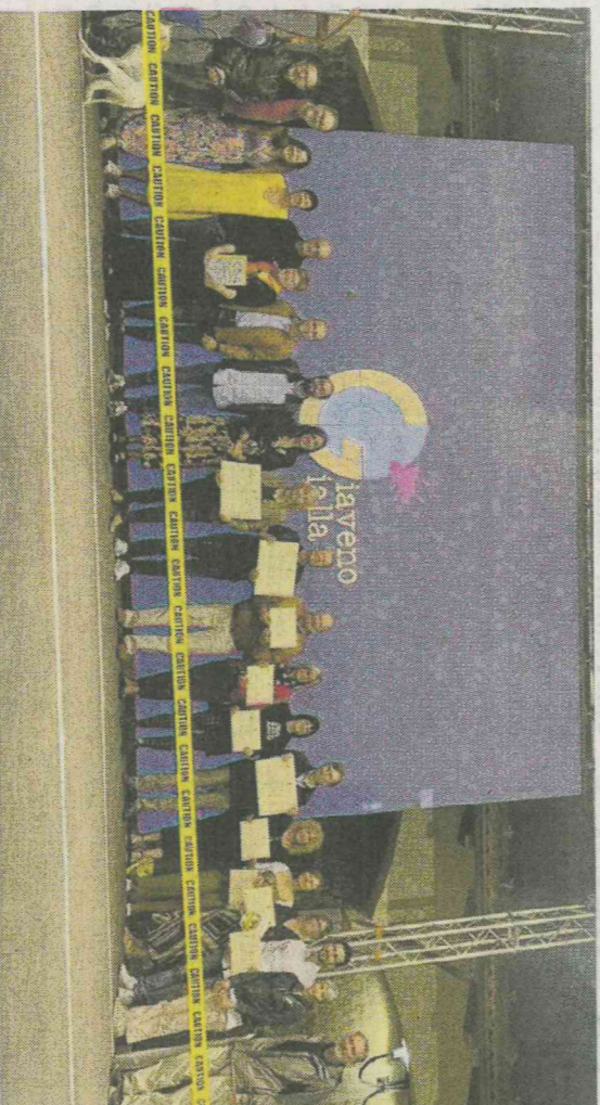
I premiati del concorso Giallo Giaveno sul palco di piazza Mautino