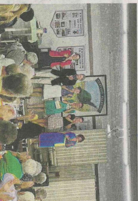
Gli attori de Ij Camolà alla cena con delitto degli alpini

tato di lettura e da una giuria di esperti, e raccolti nell'antologia "Giallo Giaveno 2" e edita da Imprimix. Di questi, sono stati decretati i primi tre classificati: al terzo posto